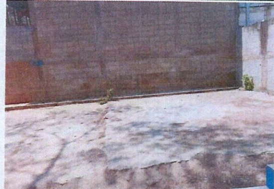
Foto 4: Área donde se contempla hacer el mejoramiento de la estructura tipo portico para galera.

Observación: Si es necesario se pueden agregar hojas adicionales y actualizar el número de hojas.