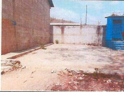
Foto 1: Área donde se contempla hacer el mejoramiento de la estructura tipo portico para galera.